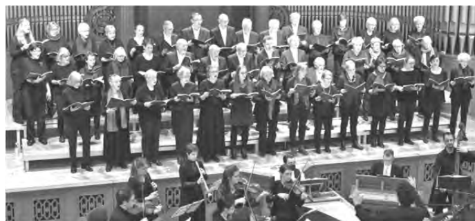
Konzert Winterthur, 12.11.2022: Händel, Alexanderfest Wettinger Singkreis und Orchester Cardinal Complex